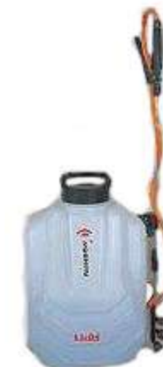
INJSANBS01 SISTEMA SPRAY A SPALLA A BATTERIA AL LITIO 10 LT