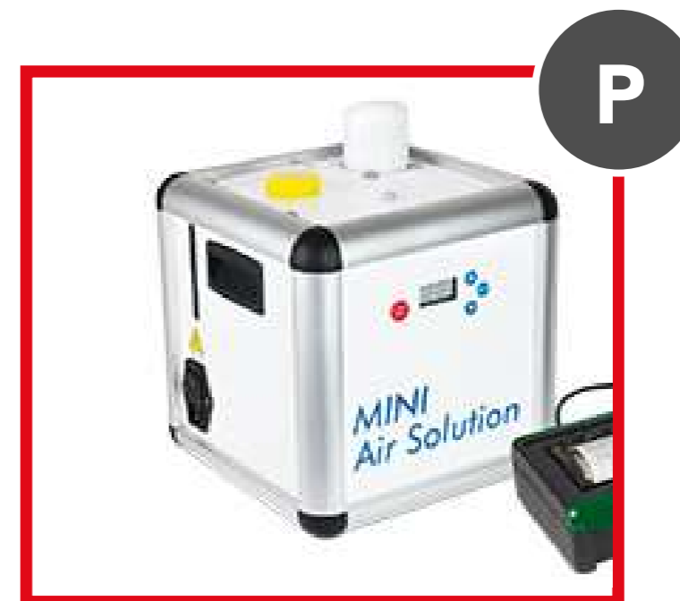
O2SMINI/S senza stampante - O2SMINI/C con stampante MINI AIR SOLUTION

Da utilizzare con il prodotto OX AIRE CONDUCTOS a base di perossido di idrogeno (5 lt - COD. O202S3000.002).