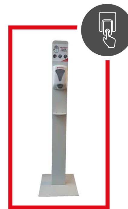
PRO39006+ EUACBA00244.AM01 SISTEMA MANUALE PER GEL IGIENIZZANTE 900 ML