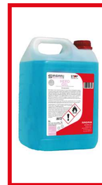
PRO39345 HERO GEL IGIENIZZANTE MANI 5 LT