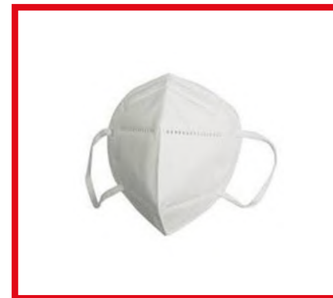
BTZ26981 MASCHERINA KN95/FFP2 S/VALVOLA