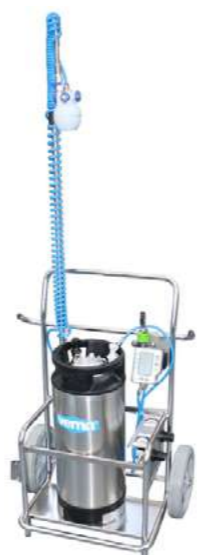
VM1000/4 MULTI SPRAY 18 LT