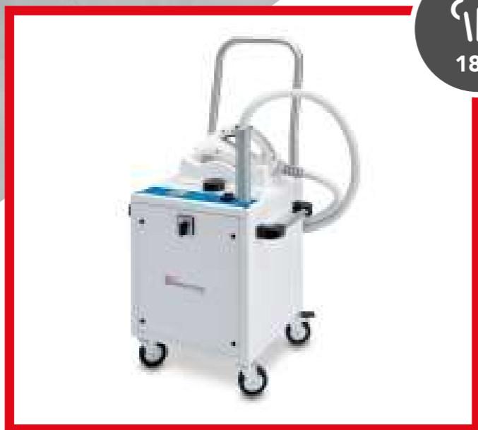
POLPTEU0301 SANI SYSTEM PRO

Da utilizzare con il prodotto HPMed 50ml che ne coadiuva l'azione sanificante (12 flaconi già compresi - COD. POLPAEU0369) o solo con vapore.