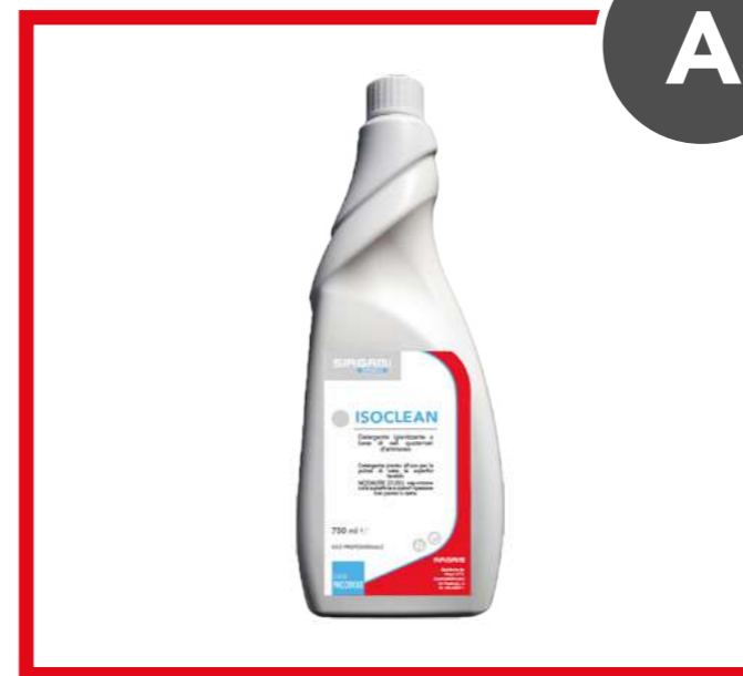
PRO39315 (750 ML) ISOCLEAN in registrazione come biocida

ISOCLEAN: sanificante ad alta concentrazione di alcol isopropilico di pronto utilizzo a spruzzo per tutte le superfici. Ottimo potere pulente e veloce nelle pratiche di igiene grazie all'elevato potere autoasciugante. Per le normali operazioni di spolvero in ambiente sanitario, della ricettività, ristorazione, civile. Tre prodotti in uno: pulizia dei vetri e superfici lucide - sanificazione - macchie di inchiostro.