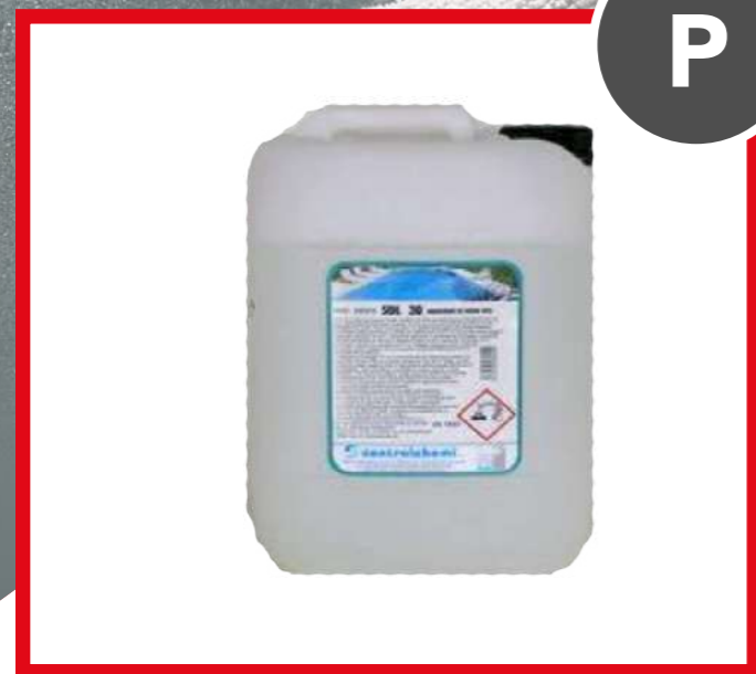
CON120020 (10 KG) OXIDAL

OXIDAL: sanificante a base di perossido di idrogeno per operazioni di sanificazione delle superfici in ambiente sanitario, civile e alberghiero. Può essere nebulizzato con apposito atomizzatore.