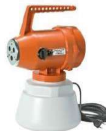
INJSAN03 ATOMIZZATORE PORTATILE ELETTRICO