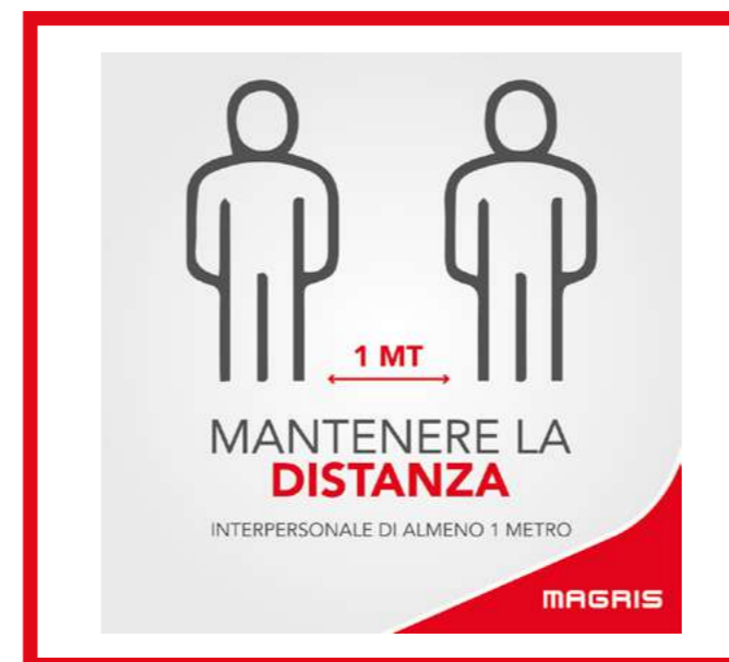
PRO39004 ADESIVO 40X40 CM MANTENERE LA DISTANZA