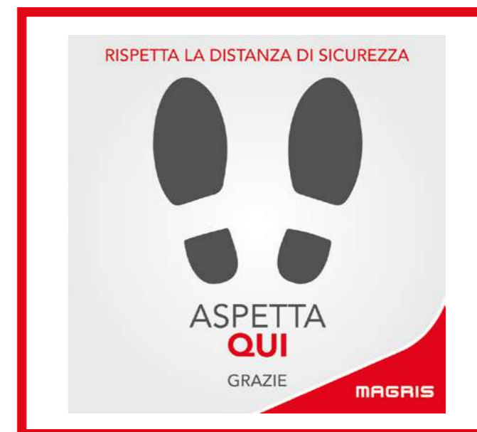
PRO39005 ADESIVO 40X40 CM ASPETTA QUI