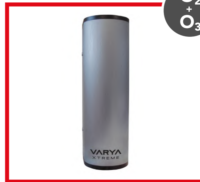
VARYA XTREME VARYA XTREME