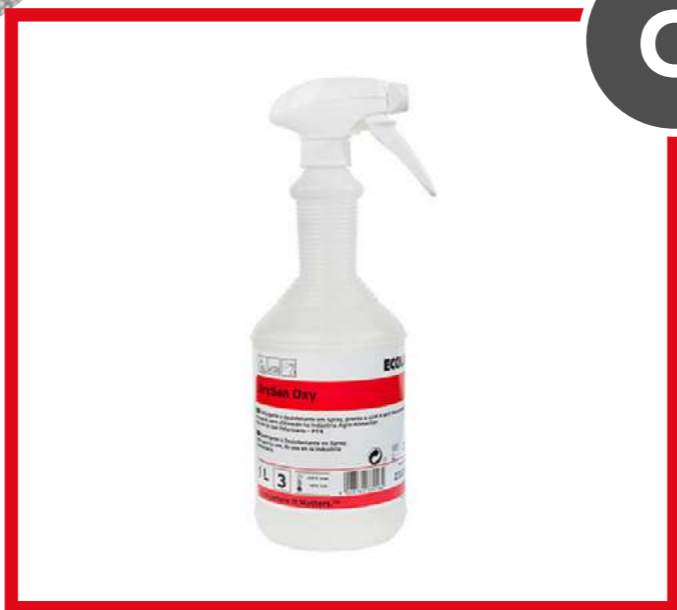
HE2330200 (1 LT) DRYSAN OXY

DRYSAN OXY: sanificante a base di ossigeno di pronto utilizzo a spruzzo per tutte le superfici. Per le normali operazioni di spolvero in ambiente sanitario, della ricettività, ristorazione, civile ecc. Può essere nebulizzato tal quale.