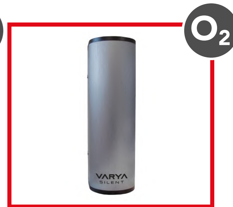
VARYA SILENT VARYA SILENT