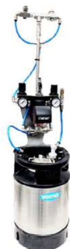
VM1785 MINI SPRAY 9 LT