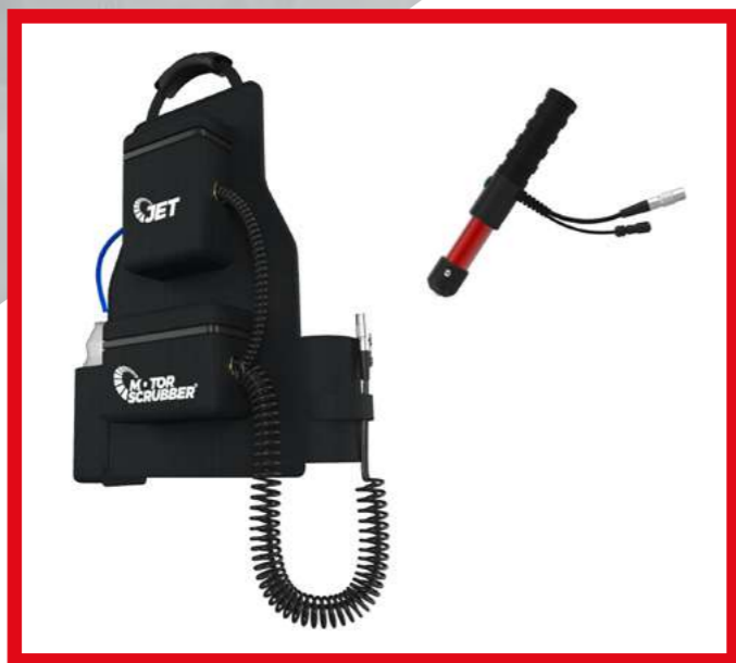
RRSTORMKIT STORM E ZAINO