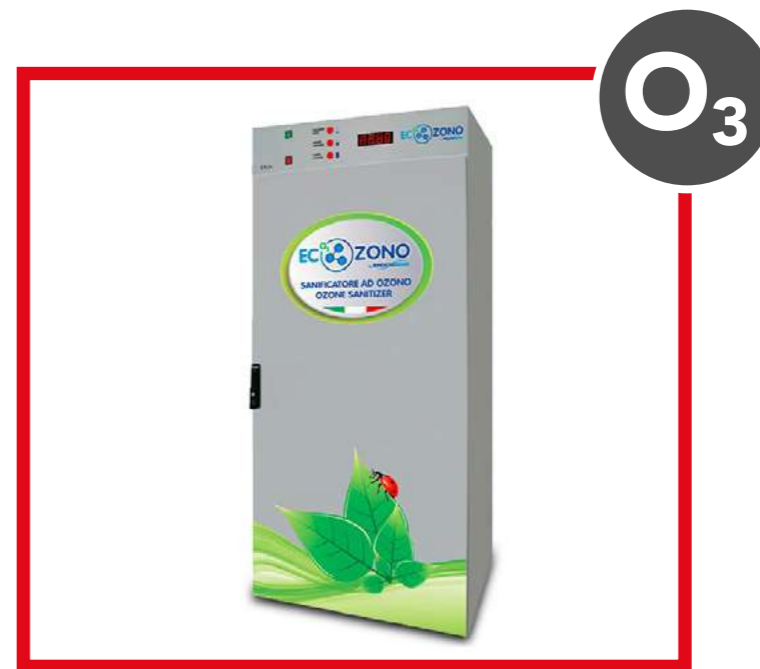
BREECOZONO CABINA ECOZONO