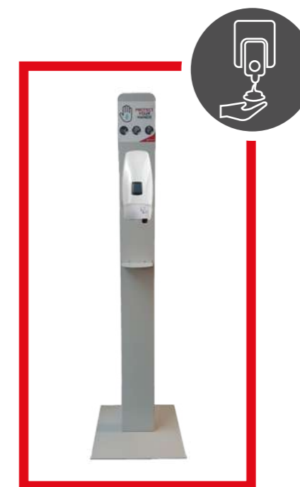
PRO39006+ PRO39007 SISTEMA AUTOMATICO PER GEL IGIENIZZANTE 1000 ML