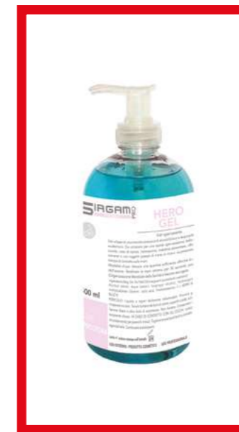
PRO39344 HERO GEL IGIENIZZANTE MANI 500 ML con pompetta ct 4pz + 4 pompette