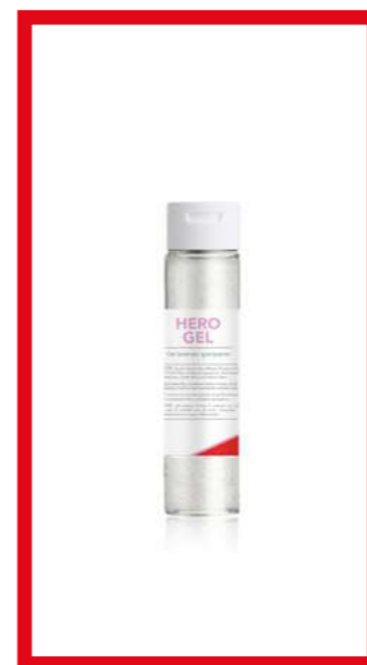
PRO39346 HERO GEL IGIENIZZANTE MANI 100ML con tappo flip-top