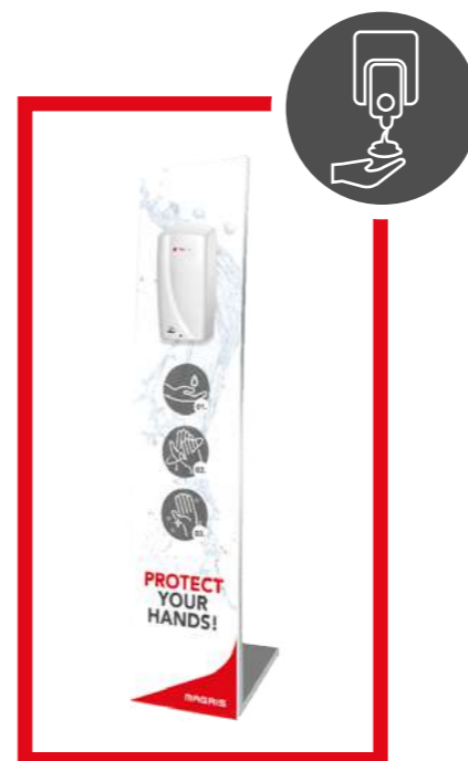
PRO39003 DISPENSER C/SENSORE + PIANTANA