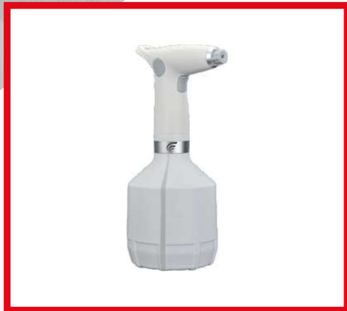
RRLEVA LEVANTE SPRAY VAPORIZZATORE