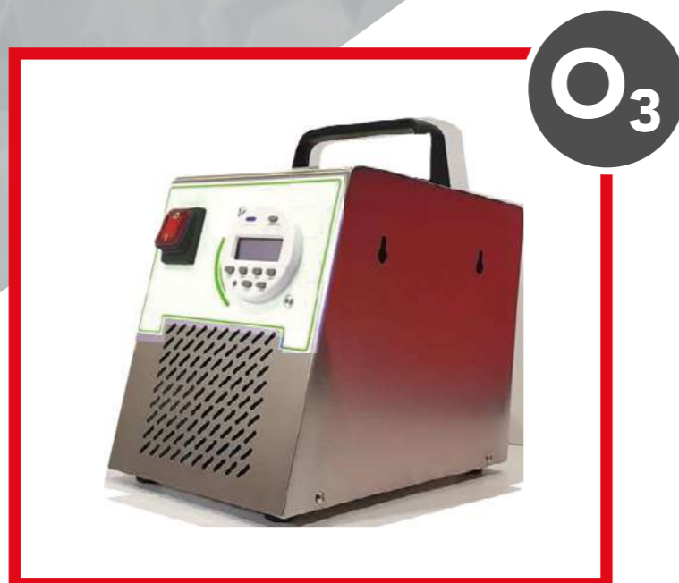
RRO310T OZONIZZATORE RRO310T