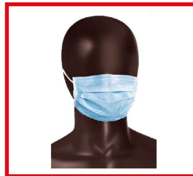
PRO39600-CF MASCHERINA 3 VELI PLP